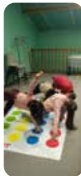
Groupe de primaire le mardi

L'idée de l'association Graines de grappe, est de semer des petites graines « culturelles », afin que chacun reparte avec une belle grappe de culture ! Elle permet à qui le souhaite, de venir s'enrichir ou bien partager avec les autres !