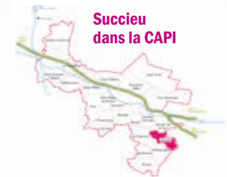
Succieu dans la CAPI