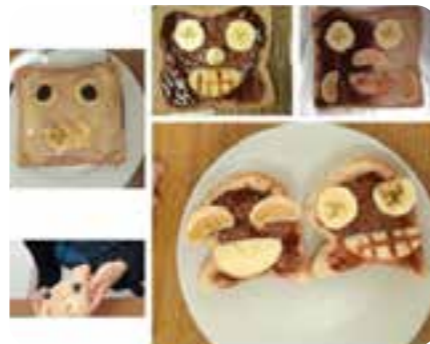
Atelier créatif « el día de los muertos » du 25 octobre 2023

Actuellement, Graines de grappe propose d'apprendre l'espagnol via des activités ludiques ! Florence, ancienne professeur d'espagnol et d'art plastique, met à profit son savoir de manière ludique pour apprendre l'espagnol tout en s'amusant ! Plusieurs événements sont prévus, notamment des stages d'espagnol durant les vacances scolaires, ou encore des ateliers créatifs avec différentes thématiques ! Vous êtes informés de ces événements via un petit flyer dans vos boîtes aux lettres ! Il est également prévu des sessions discussions pour les adultes, que vous soyez débutants ou pas, vous êtes les bienvenus !